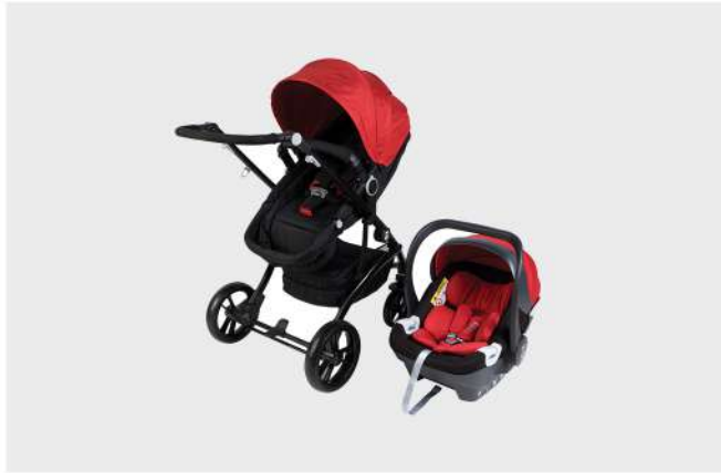
CARRO RUA G16 + HBR-X1 PRETO / VERMELHO DUO CARRO E CADEIRA