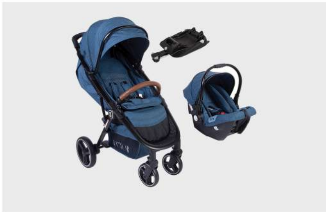
CUXOR C688 + ID10 PRETO / AZUL TRIO CARRO, CADEIRA E BASE