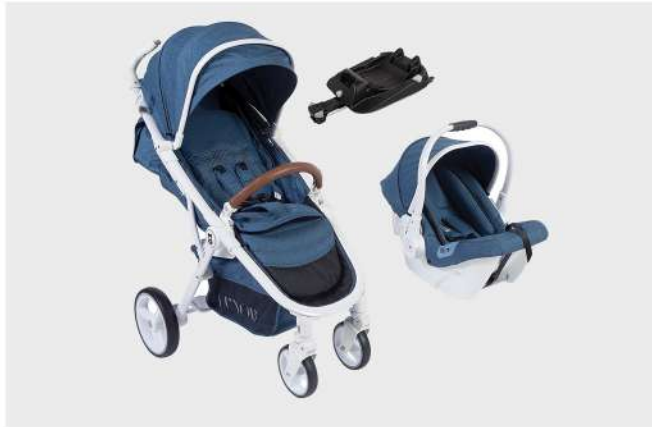
CUXOR C688 + ID10 BRANCO / AZUL TRIO CARRO, CADEIRA E BASE