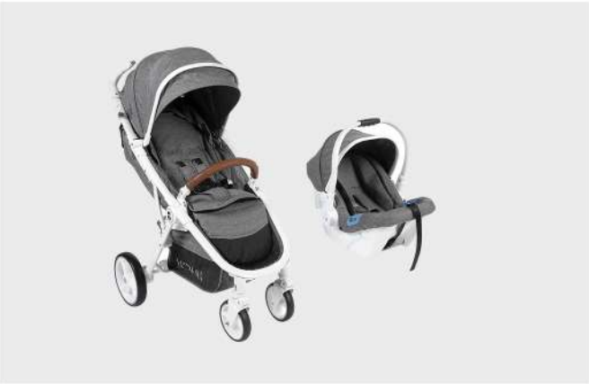
LUXOR C688 BRANCO / CINZA DUO CARRO E CADEIRA