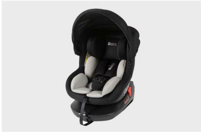
CAD. AUTO BCC-A7 PRETO GR. 0+ / I Com sistema de rotação 360°