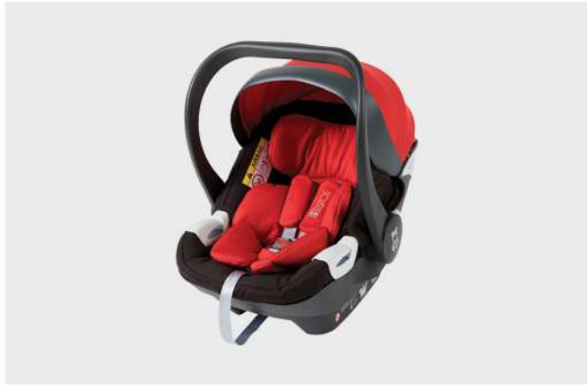
CAD. AUTO HBR-X1 PRETO/VERMELHO GR. 0+