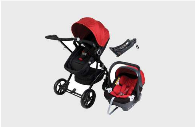
CARRO RUA G16 + HBR-X1 - PLUS PRETO / VERMELHO TRIO CARRO, CADEIRA E BASE