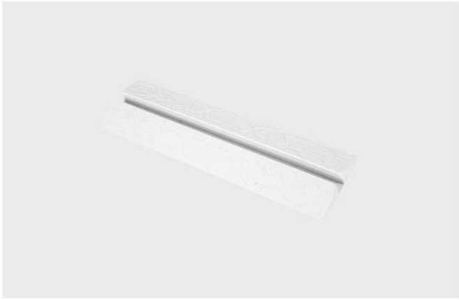
RAMPA XY-025 Rampa para barreira.