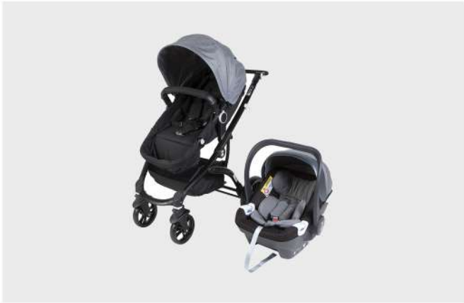
CARRO RUA G16 + HBR-X1 PRETO / CINZA DUO CARRO E CADEIRA