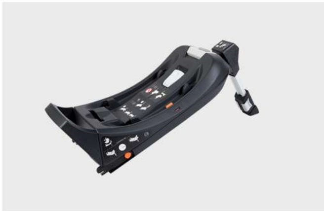
BASE HBR-X1-PLUS ISOFIX Base para CAD. HBR-X1