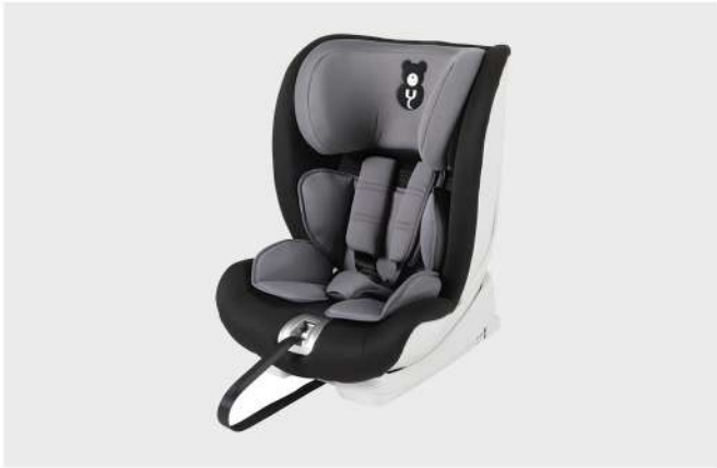
CAD. AUTO ST-2 CINZA GR. I / II / III