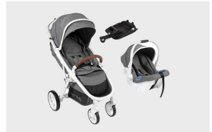
CUXOR C688 + ID10 BRANCO / CINZA TRIO CARRO, CADEIRA E BASE