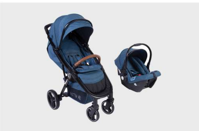
LUXOR C688 PRETO / AZUL DUO CARRO E CADEIRA