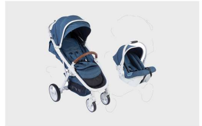
LUXOR C688 BRANCO / AZUL DUO CARRO E CADEIRA