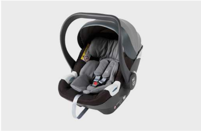
CAD. AUTO HBR-X1 PRETO/CINZA GR. 0+