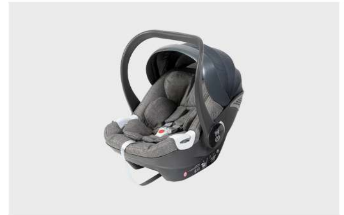
CAD. AUTO HBR-X1 CINZA/BK GR. 0+