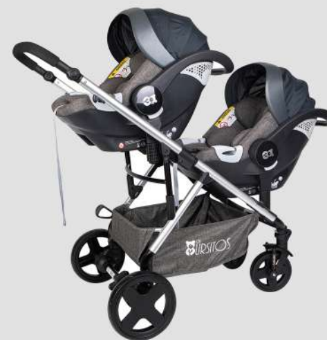
CADEIRAS GR0+ VENDIDO SEPARADO DO ARTIGO ST2222