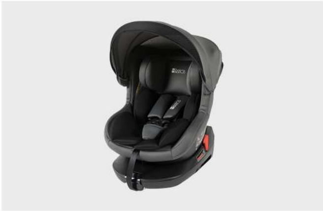
CAD. AUTO BCC-A7 CINZA GR. 0+ / I Com sistema de rotação 360°