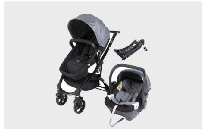
CARRO RUA G16 + HBR-X1 - PLUS PRETO / CINZA TRIO CARRO, CADEIRA E BASE